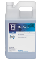
HUSKY® 441 MaxSuds

Sumerjir durante 10 segundos. Comparar mientras está mojado. Partes por millón.