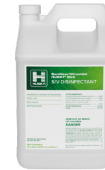
HUSKY® 803 S/V Disinfectant